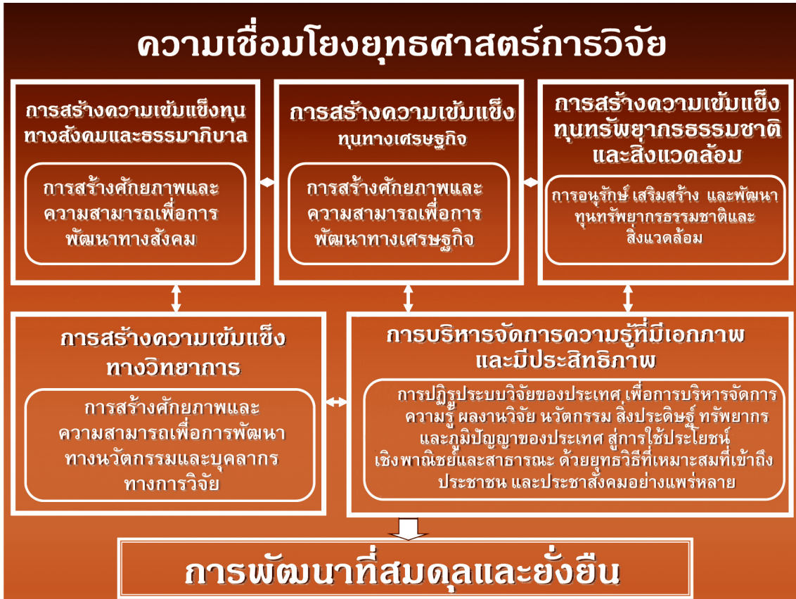
ภาพที่ 3 ความเชื่อมโยงยุทธศาสตร์การวิจัยของชาติสู่เป้าหมายการพัฒนาที่สมดุลและยั่งยืน