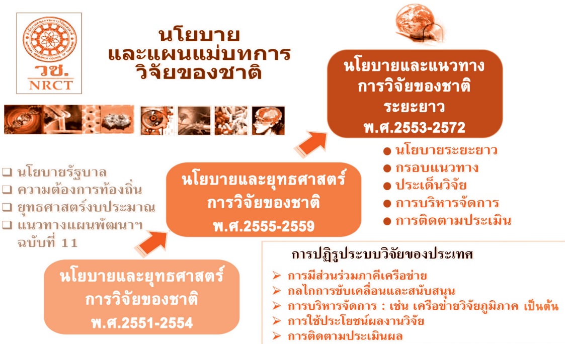
ภาพที่ 1 ความเชื่อมโยงของการพัฒนานโยบายและยุทธศาสตร์การวิจัยของชาติ

นโยบายการวิจัยของชาติดังกล่าวรองรับวิสัยทัศน์การวิจัยของชาติ คือ “ประเทศไทยมีและใช้งานวิจัยที่มีคุณภาพ เพื่อการพัฒนาที่สมดุลและยั่งยืน” โดยมีพันธกิจการวิจัยของชาติ คือ “พัฒนาศักยภาพและขีดความสามารถในการวิจัยของประเทศให้สูงขึ้น และสร้างฐานความรู้ที่มีคุณค่า สามารถประยุกต์และพัฒนาวิทยาการที่เหมาะสมและแพร่หลาย รวมทั้งให้เกิดการเรียนรู้และต่อยอดภูมิปัญญาท้องถิ่น เพื่อให้เกิดประโยชน์เชิงพาณิชย์และสาธารณะ ตลอดจนเกิดการพัฒนาคูณภาพชีวิต โดยใช้ทรัพยากรและเครือข่ายวิจัยอย่างมีประสิทธิภาพ ที่ทุกฝ่ายมีส่วนร่วม”